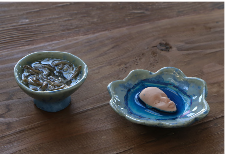
Juin 2023 - Sculptures réalisées en Mai 2021, vue d'installation (porcelaine, bois, champignons, cire à épiler, eau, grès noir), Villa Arson, Nice